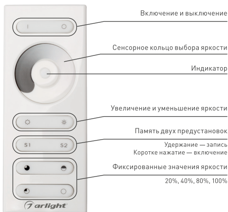
Рисунок 2. Назначение кнопок на пульте ДУ.

Чтобы привязать пульт к дополнительным диммерам проделайте операцию привязки для каждого диммера.