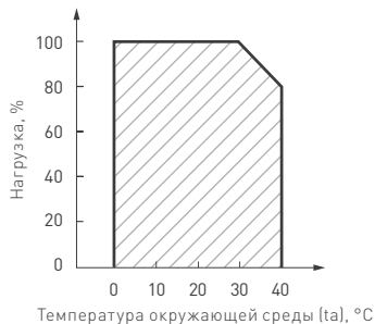
Рис. 2. Максимальная допустимая нагрузка, % от мощности источника.