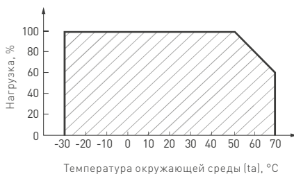
Рис. 2. Максимальная допустимая нагрузка, % от мощности источника.