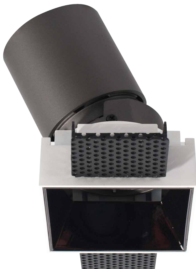
Встраиваемый точечный светодиодный светильник CASS QVZ FLEX